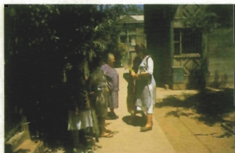
Santiago de Chile. Comunidad Andalucía