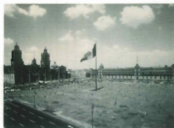
Ciudad de México. Zócalo

A mediados de los años ochenta la Consejería de Obras Públicas y Transportes se encontraba inmersa en el empeño de dar respuesta a una serie de problemas aún no resueltos en