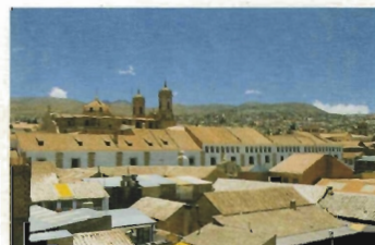
Potosí. Vista general

Otros departamentos de la Consejería se fueron sumando a los programas de cooperación, siendo de destacar el de transferencia tecnológica en materia de aguas que la Secretaría General de Aguas viene ejecutando en Marruecos o los de ayuda a la reconstrucción de los países de Centroamérica afectados por el huracán Mitch en el que la Empresa Pública de Suelo de Andalucía participa activamente.