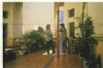
Buenos Aires. Manzana San Francisco

Los primeros contactos se inician con Marruecos y con los países del ámbito latinoamericano con ocasión de la asistencia de responsables de la Consejería a encuentros de carácter científico, técnico y cultural. A raíz de estos encuentros se solicitó ayuda a la Junta de Andalucía generándose de forma ineludible los primeros compromisos en materia de cooperación. El proceso largo y pausado comenzó a finales de la década de los ochenta cuando las Direcciones Generales de Arquitectura y Vivienda y de Ordenación del Territorio y Urbanismo iniciaron las primeras actuaciones: se presta apoyo técnico y financiero para la recuperación de edificios en los centros históricos con el objetivo de que los habitantes carentes de recursos económicos pudiesen conservar sus viviendas y se asesora para la redacción de planeamiento urbanístico con el fin de organizar un crecimiento equilibrado de las ciudades que fuese respetuoso con el entorno.