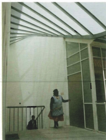
Quito. Casa de los siete patios