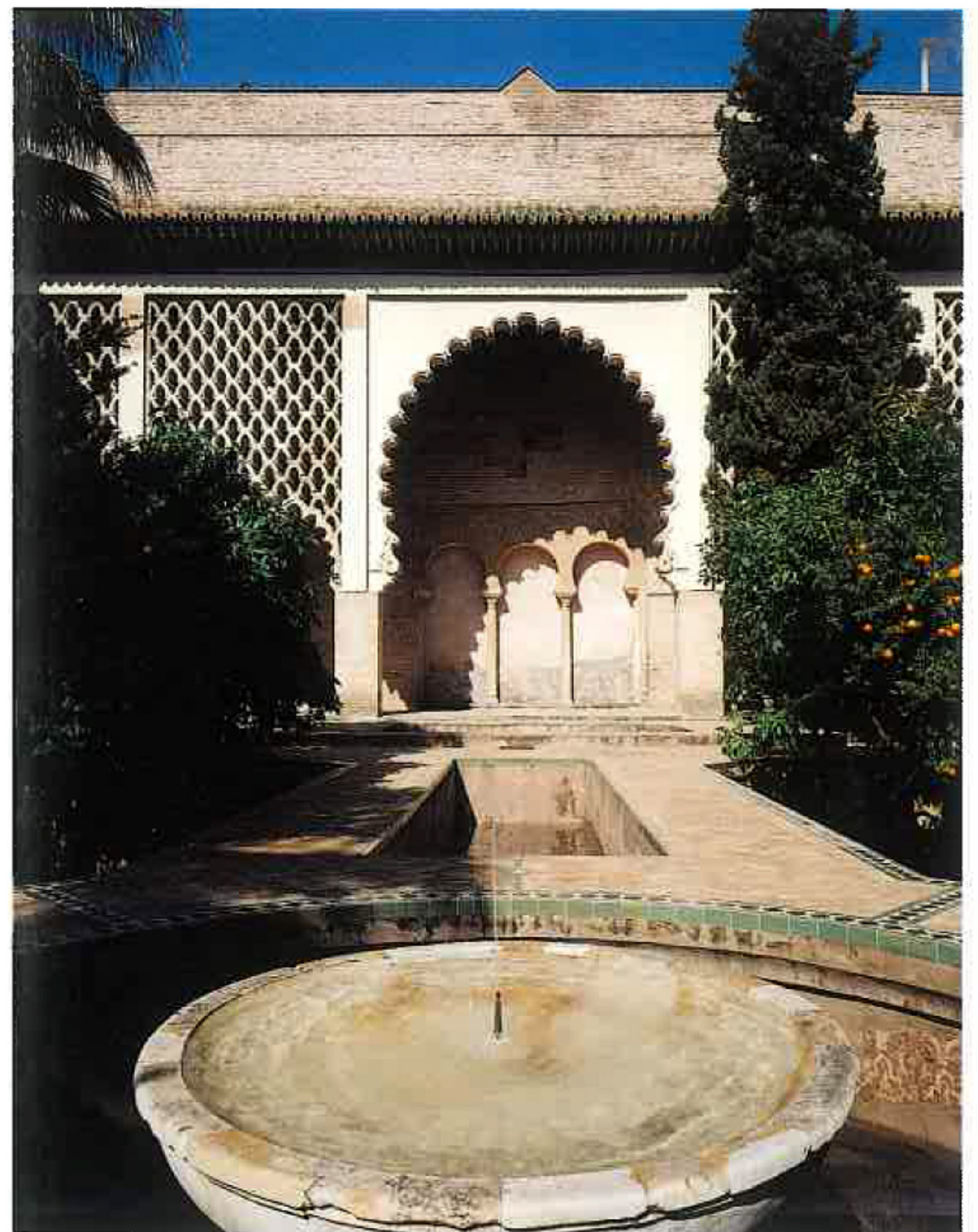
ARQUERÍA DE HERRADURA EN LA FACHADA NORTE