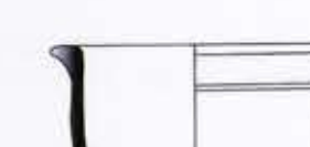
Cerámicas de niveles medievales islámicos