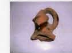
Cerámicas de niveles modernos y contemporáneos