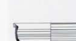
Cerámicas de niveles medievales islámicos