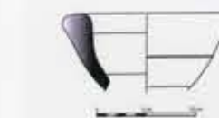
Borde de ánfora romana Hallam-70 (S.I D.C.), localizada en los niveles más profundos