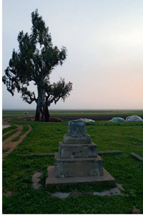
Monolithe de la bataille de Oued el-Makhzen (1578).