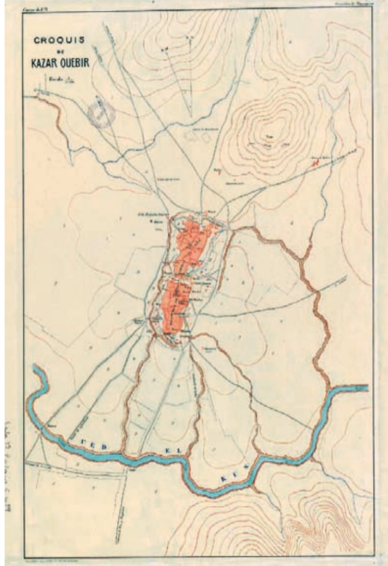
Ksar el-Kébir, 1883. Carnison de Estado Mayor (Armée Espagnole). Cartilla de Comer, Instituto Navagado de Barcelona.