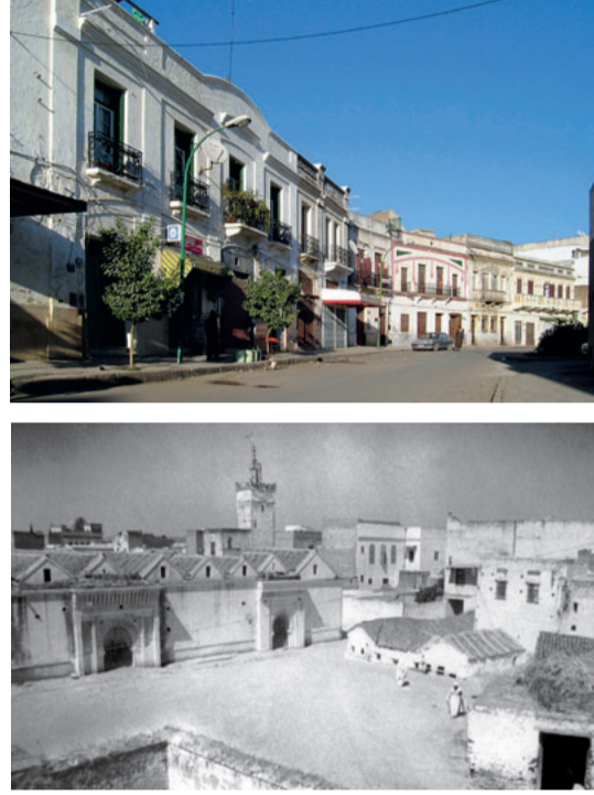
Avenue Sidi Bouahmed (en haut) et Mosquée Saïd (premières années XX e siècle).

de l'hostilité des Portugais d'Asilah. Aux XV e et XVI e siècles, elle subit des incursions et des actes de pillage, généralement infructueux sur le plan militaire. Le plus douloureux de ces épisodes fut l'aventure malheureuse du roi Sébastien I er du Portugal, l'événement historique le plus important de la ville, qui eut des répercussions considérables sur la politique européenne: la bataille de Ksar el-Kébir ou d'Oued el-Makhzen. Elle se déroula le 4 août 1578 sur les rives du Makhzen, au nord de la ville, et se termina par la mort du roi portugais lors des combats ainsi que du sultan Abdelmalik et de son neveu al-Moutaouakil, qui avait été détrôné par son oncle. Le vainqueur de la bataille fut le frère cadet d'Abdelmalik, Moulay Ahmed, proclamé sultan sur le champ de bataille, qui alla adopter le nom d'al-Mansour, le Victorieux, et d'Eddahbi, l'Aurique. C'est al-Mansour qui renforça le pouvoir de la dynastie des Saadiens, originaire du sud du pays, obtenant l'indépendance réelle du Maroc contre les ingérences européennes et turques.