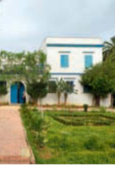
44. Consulat espagnol.