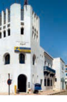
28. Vieux du début du XIX e siècle sur l'avenue Mohammed V.