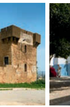
4. Place de l'Anouar.