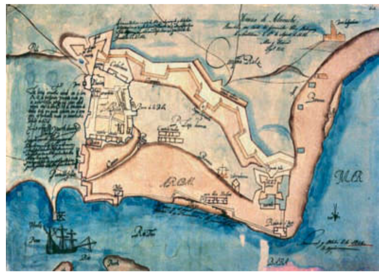
Plan de Larache (XVI e siècle)

exceptionnels. Le fort de Lakbibat se dresse sur un plan carré, avec une cour d'armes centrale et des bastions aux quatre coins. Il surplombe l'embouchure du Loukoux, à la pointe nord-ouest de la Médina.