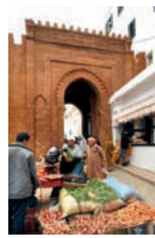
1. Porte de la Casbah.

6. Fort de Lakbibat (des petites couples). Après la bataille des Trois Rois en 1578, le sultan Ahmad al-Mansur al-Dahabi donna l'ordre d'agrandir et de renforcer les fortifications situées à l'embouchure du fleuve, ainsi que de bâtir le fort de Laklak, ou fort de la Gigoque. Ces deux ouvrages défensifs appartiennent au style de fortification italien du XVI e siècle, dont ils constituent deux exemples