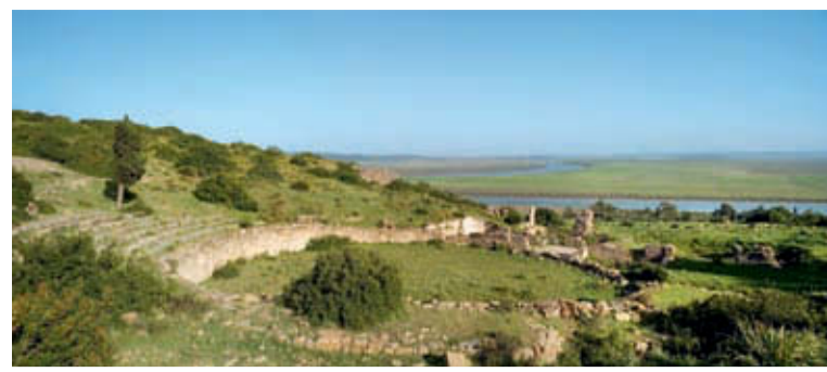
Les ruines archéologiques de Lixus.