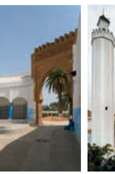
5. Mausolée de Sidi Abdelkrim.