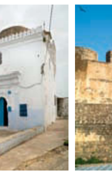
12. Porte de la Douane (Bab Diwana).