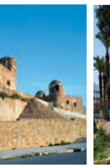
18. Porte de la médina.