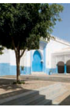
4. Mosquée de l'Anouar.