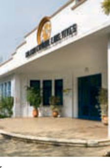
35. Marché central.