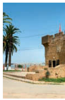
2. Tour du Juif.