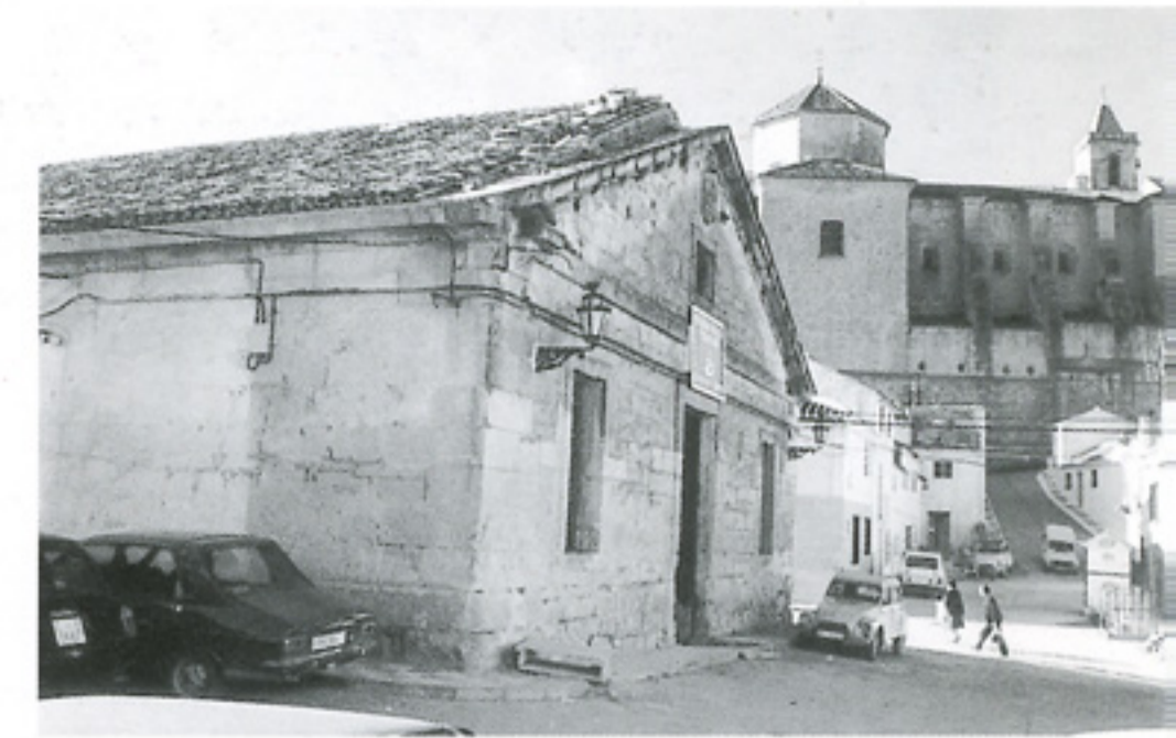
Estado anterior a la obra.