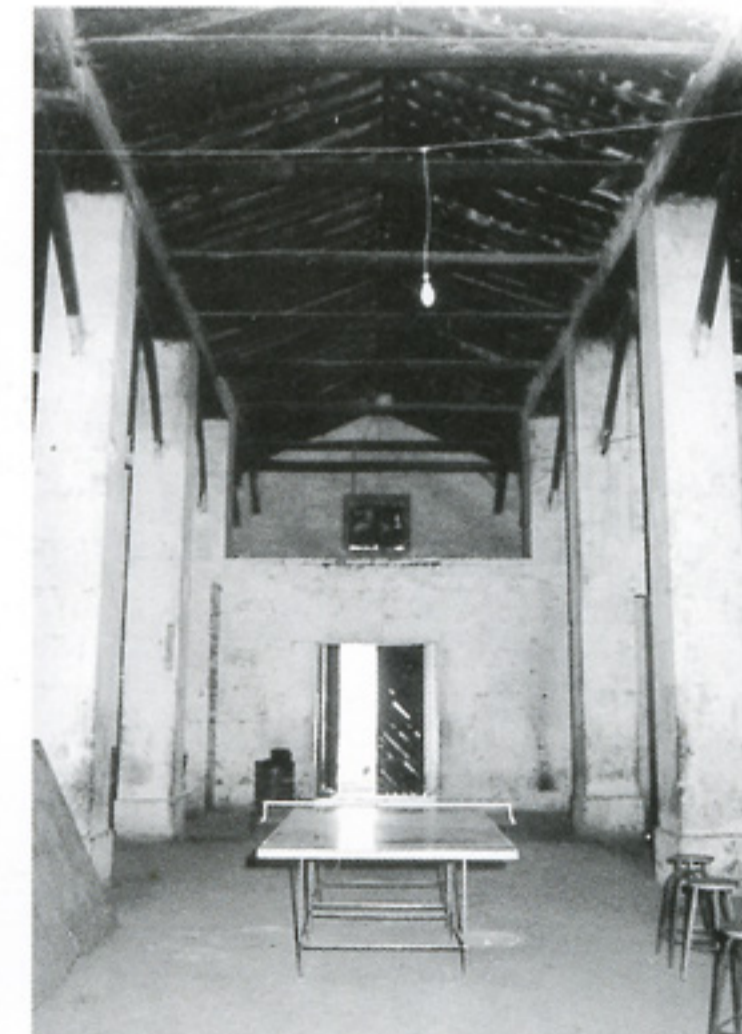
Superior: Interior del edificio antes de las obras de 1.985.