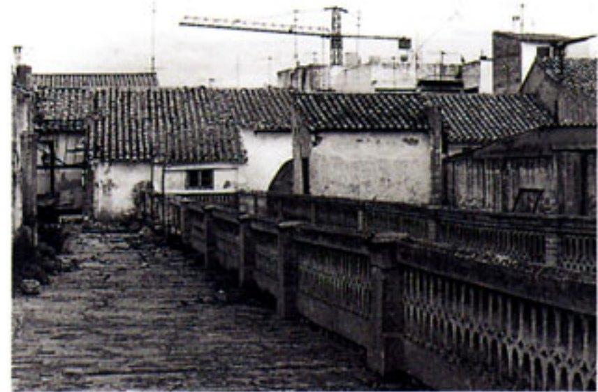
Estado anterior a la obra.

Dentro de este programa se ha llevado a cabo la rehabilitación del antiguo Pasaje del Carmen en Puente Genil, edificio que tipológicamente responde a unas características especiales determinantes para su recuperación con destino a 18 viviendas sociales.