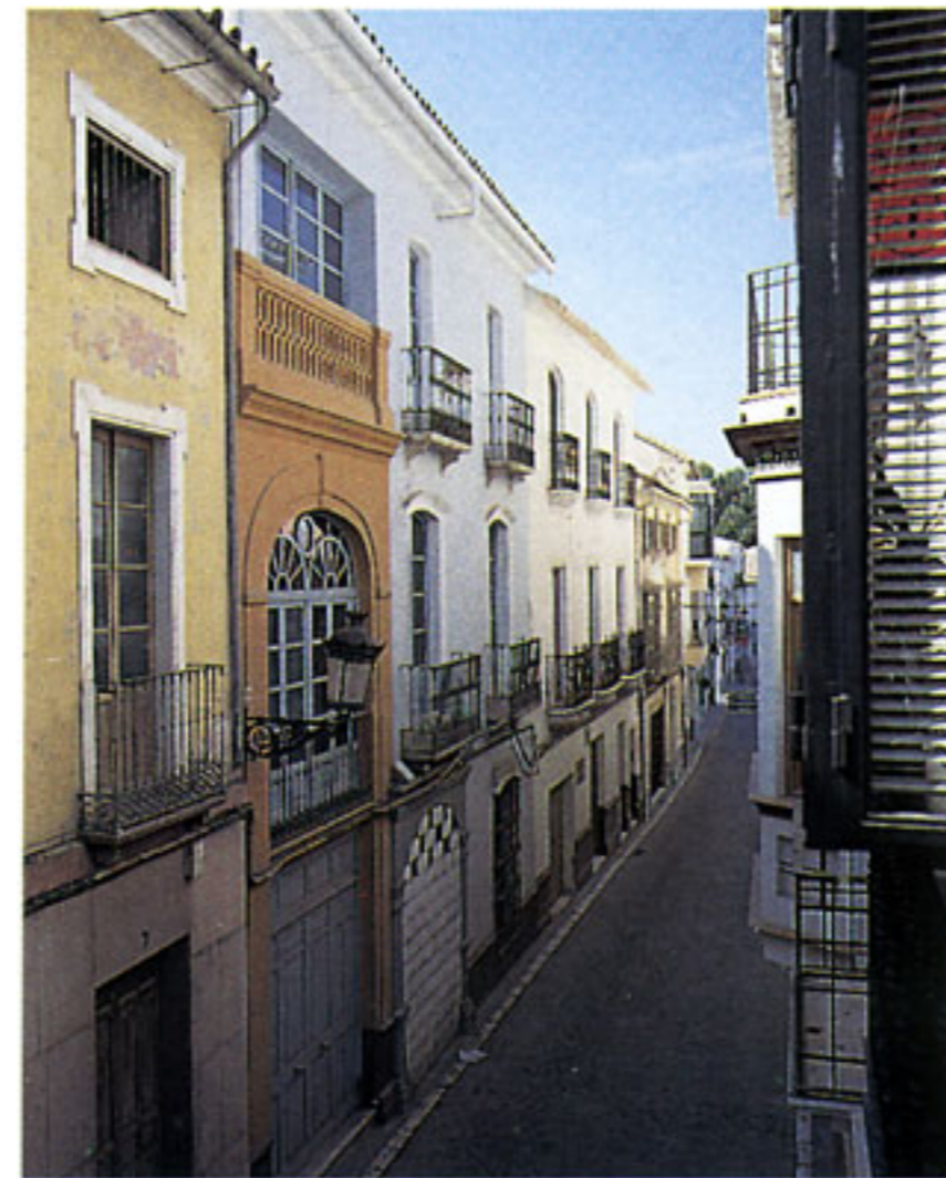
Estado de la fachada antes de la obra.

En 1915 el edificio cambió de propietario que lo adaptó a un nuevo uso de viviendas. Las obras se cree fueron efectuadas por Rodrigo García, autor de edificios relevantes en la población: el teatro Circo, el edificio en que ahora está ubicado el Casino, la fábrica de electricidad de la Aurora y la fábrica de harinas El Carmen.