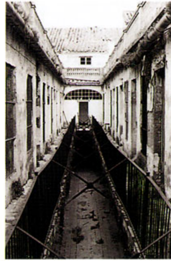
Estado anterior a la obra.