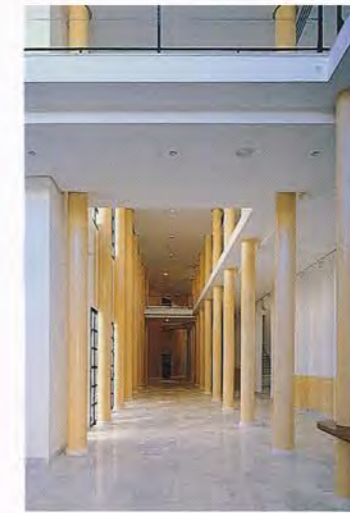
Espacio de exposiciones