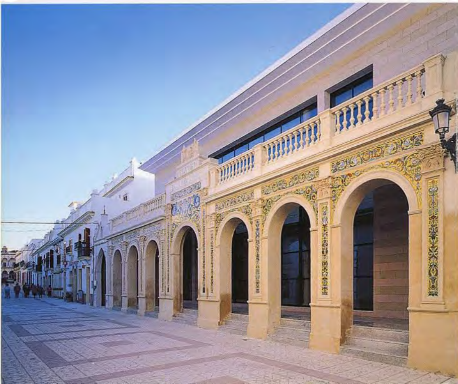
Vista de la fachada. Calle Andalucía