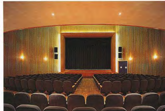
Vistas de la sala desde el fondo y el proscenio

En la realización del proyecto se han tenido muy en cuenta los materiales y los acabados de todo el edificio, entre los que destacan la madera y el estuco, así como el aprovechamiento máximo, allí donde es posible, de la luz natural.