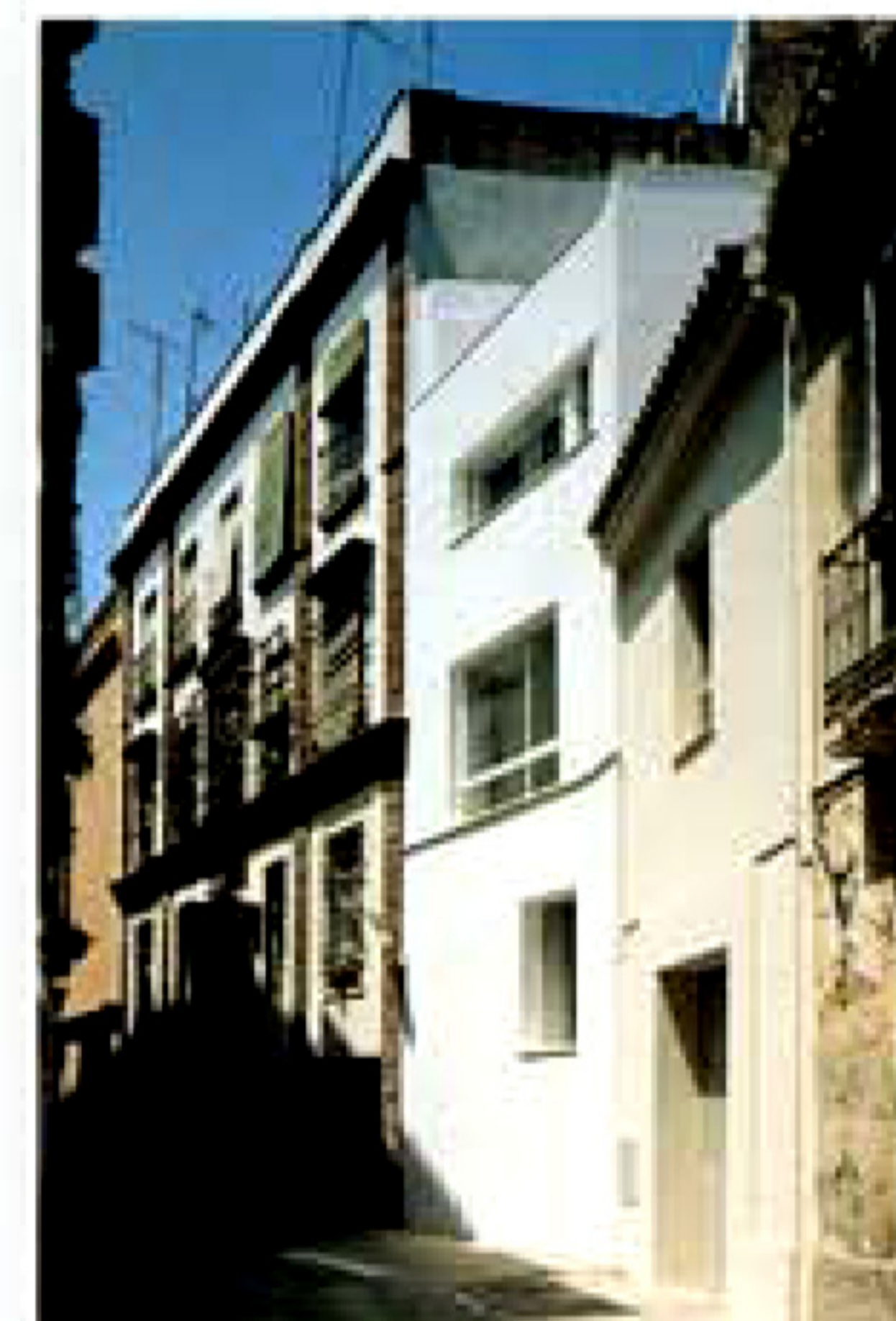
Fachada a calle Conde de Ybarra

La actuación se sitúa en el núcleo más antiguo de la ciudad, en un solar delimitado por un intrincado perfil de medianeras, que estaba anteriormente configurado por tres parcelas: los dos corrales de las calles Tromperos y Vírgenes y la casa 17 y 19 de esta última calle. En el momento de iniciar la intervención no existía ya ninguna edificación sobre los mismos, pero la Comisión del Patrimonio Histórico obligó al mantenimiento de la identificación de las parcelas, así como al "cosido" de la edificación a las medianeras, para determinar una serie de llenos y vacíos a modo de los que existían en los antiguos corrales.