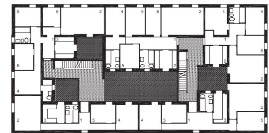
1. INGRESO 2. SALA 3. COCINA 4. DORM. PRINCIPAL 5. DORM. DOBLE 6. DORM. SENCILLO