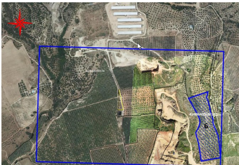
COORDENADAS PARCELA 141