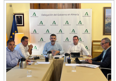
Momento de la reunión entre la consejería y los alcaldes

El aumento en 150.000 hectáreas sitúa a Sierra Nevada y su entorno dentro del Top 10 de las 53 Reservas de la Biosfera.