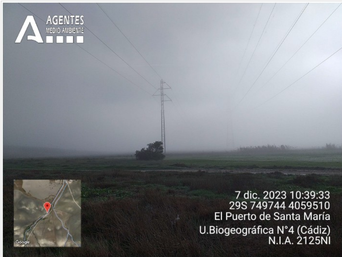
Foto n.º 23: Líneas eléctricas sobrevolando la V. P. al suroeste del humedal

CONSEJERÍA DE SOSTENIBILIDAD Y MEDIO AMBIENTE DELEGACIÓN TERRITORIAL EN CÁDIZ