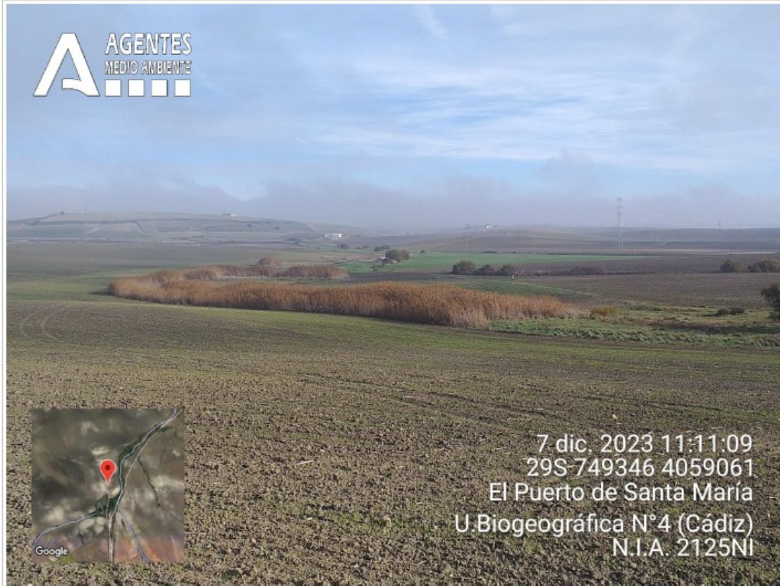
Foto n.º 44: Vista de la Cañada del Canuto y al fondo el humedal desde una colina al suroeste