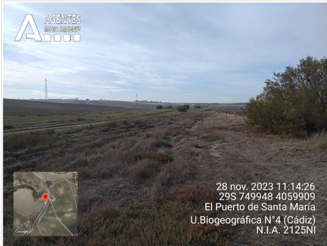
Foto n.º 20: V. P. Cañada del Hato de la Carne o del Canuto a la altura del humedal