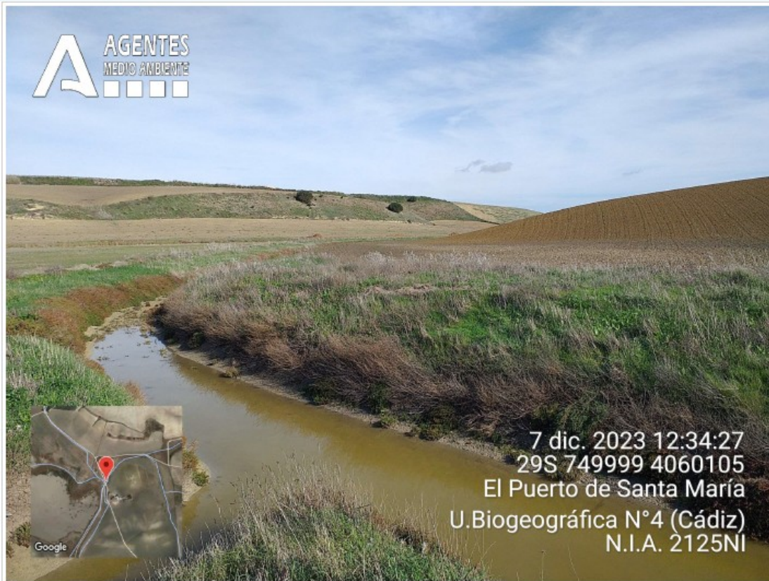
Foto n.º 29: Continuation of the V. P. after passing the wetland towards T. M. de Jerez

CONSEJERÍA DE SOSTENIBILIDAD Y MEDIO AMBIENTE DELEGACIÓN TERRITORIAL EN CÁDIZ