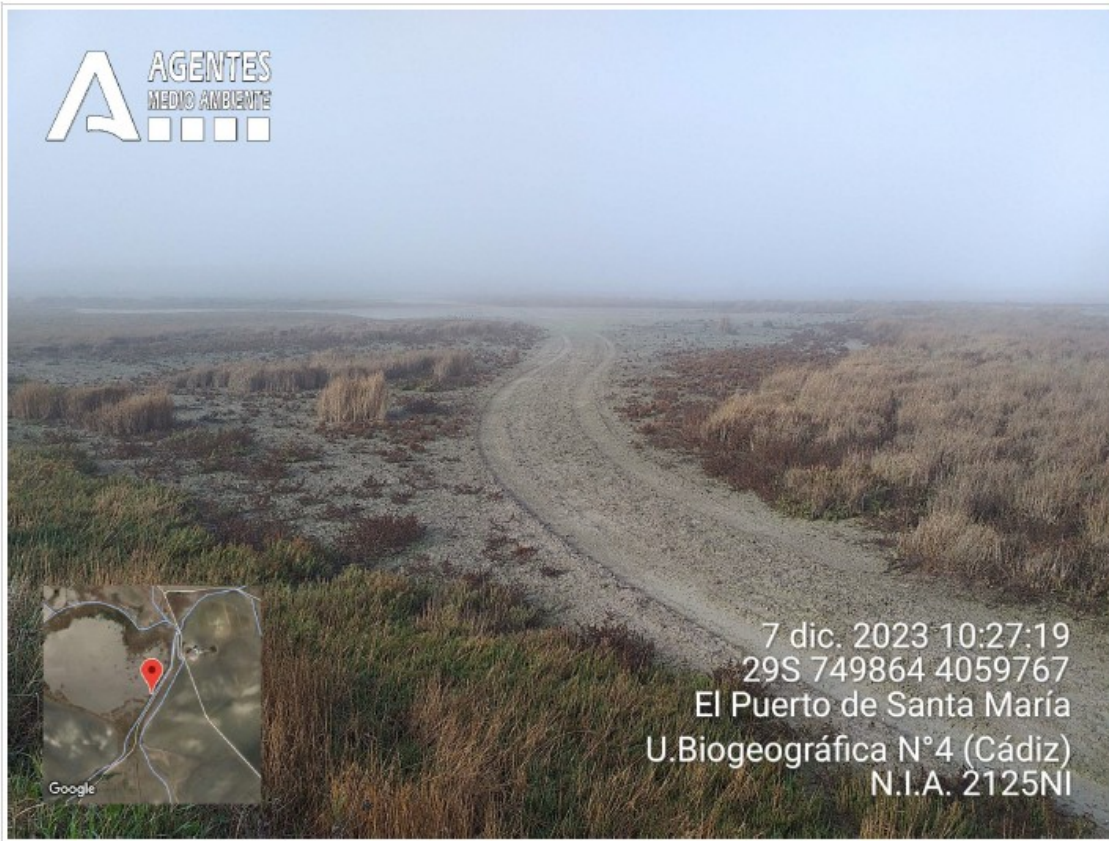
Foto n.º 8: Vista desde el sureste, rodadas en dirección al interior del humedal