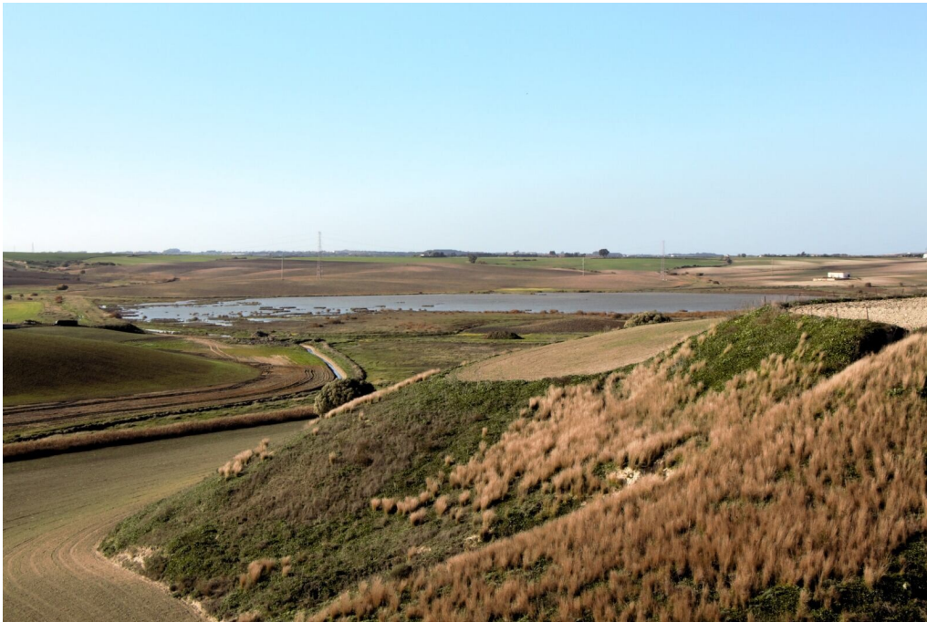
Foto n.º 57 Vista de la laguna desde el cerro de Pozo Lozano situado al sureste.

Plaza Asdrúbal, 6, 3ª planta. Edificio Junta de Andalucía. 11008 Cádiz Teléfono 956008700 – Fax: 956900004 Correo electrónico: sg.ma.dtca.cagpds@juntadeandalucia.es