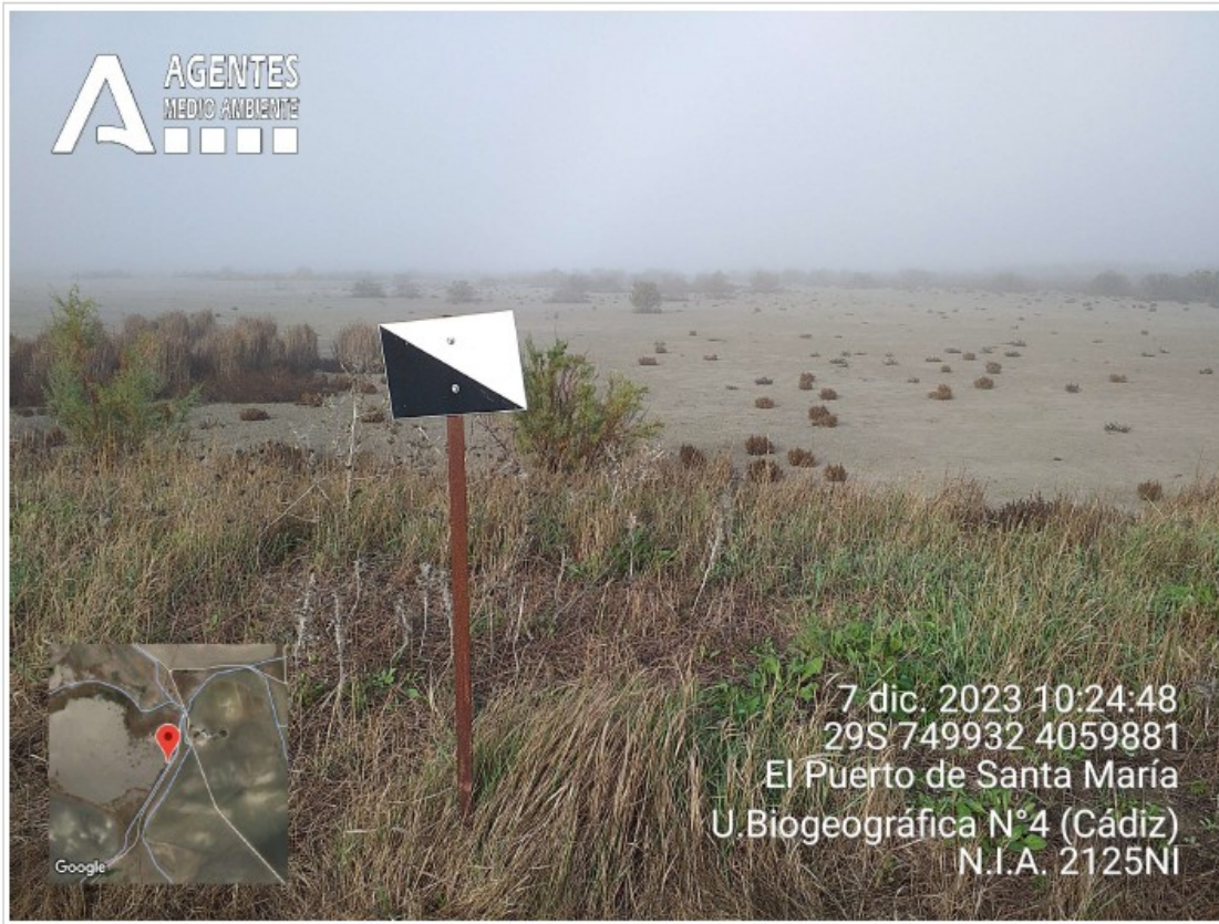
Foto n.º 17: Tablilla de coto en la linde del humedal con la V. P. del Canuto