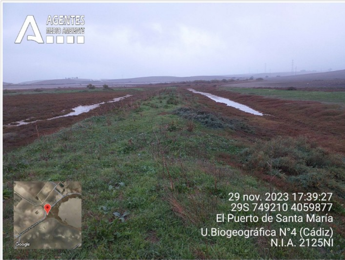
Foto n.º 32: Lomo en la Vereda de la Doctora con humedal a la izquierda y caño a la derecha