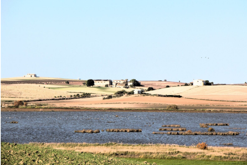
Foto n.º 56 Vista de la laguna desde la orilla este en dirección noroeste. Al fondo la Viña El agostado