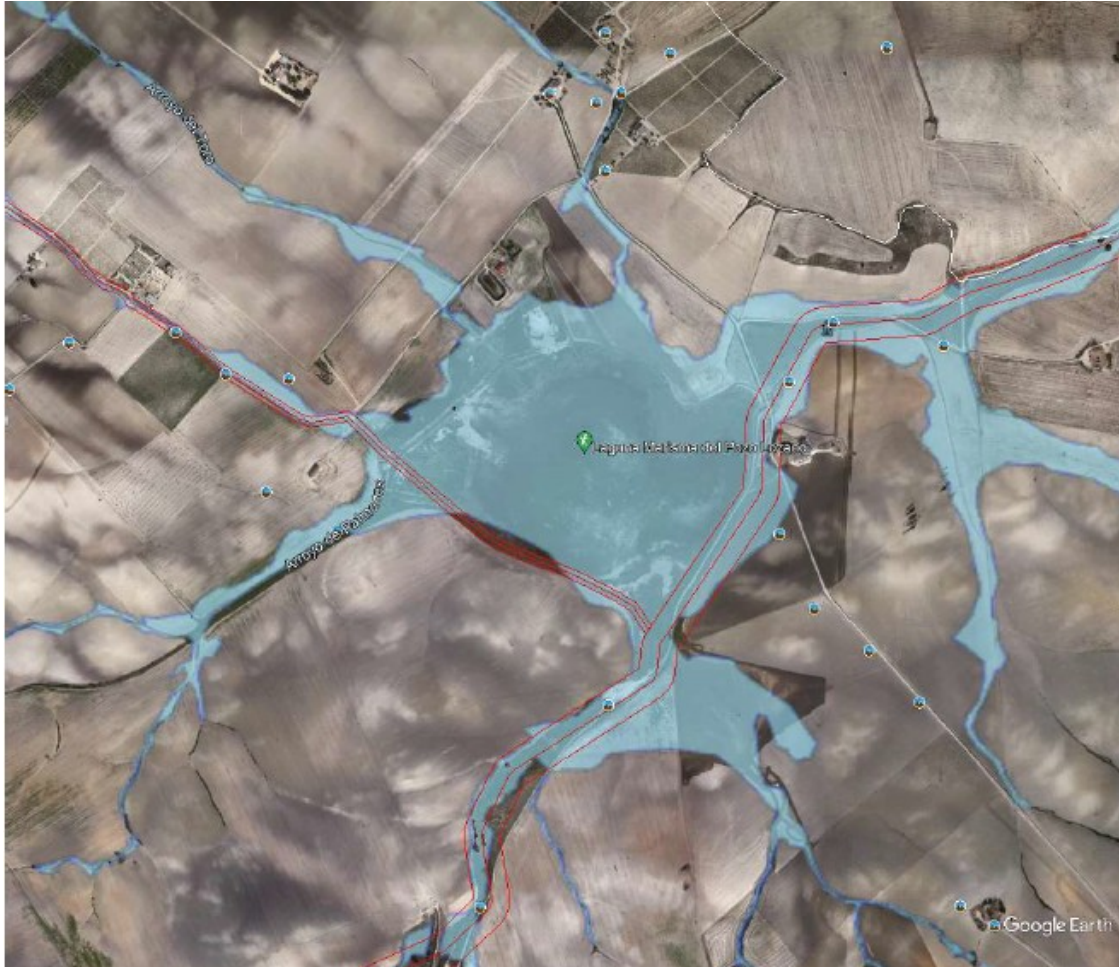
Zona inundable para un período de retorno de 500 años

Plaza Asdrúbal, 6, 3ª planta. Edificio Junta de Andalucía. 11008 Cádiz Teléfono 956008700 – Fax: 956900004 Correo electrónico: sg.ma.dtca.cagpds@juntadeandalucia.es