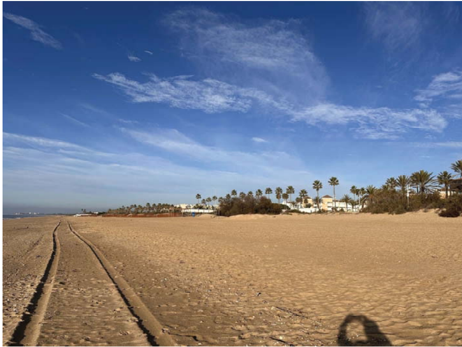
Imagen desde acceso de central hacia Poniente.