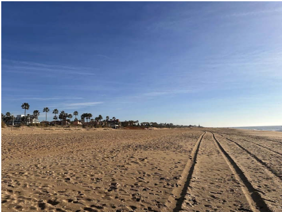
Imagen desde acceso central orientado hacia levante.