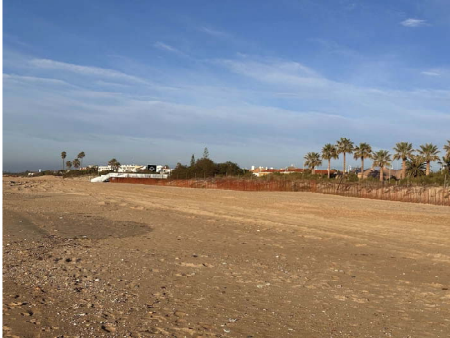
Imagen del extremo de poniente de la Playa (encuentro con Urbasur)