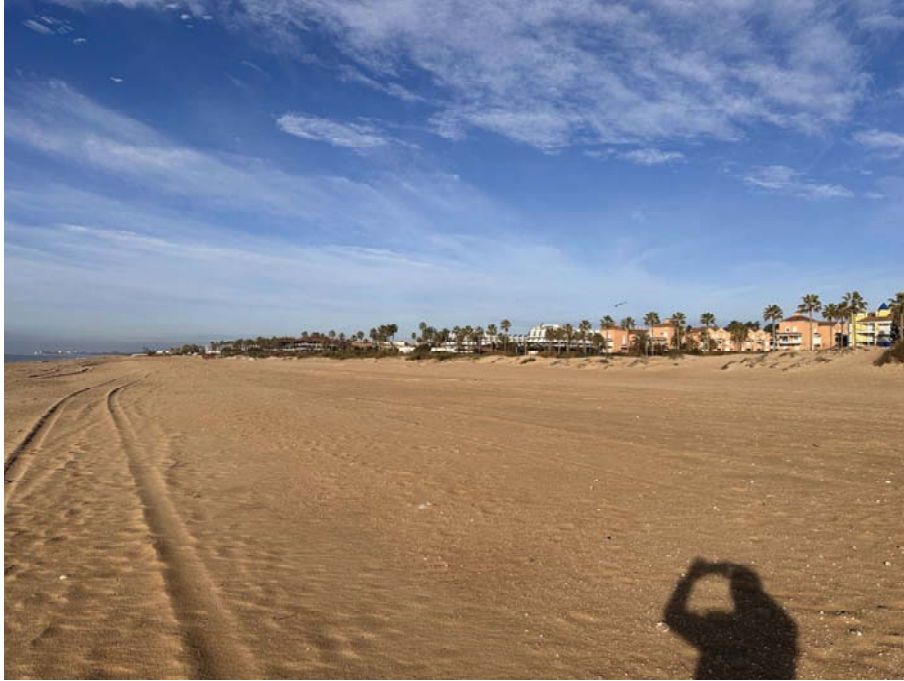
Imagen desde acceso del Paseo de Lepe mirando hacia poniente.