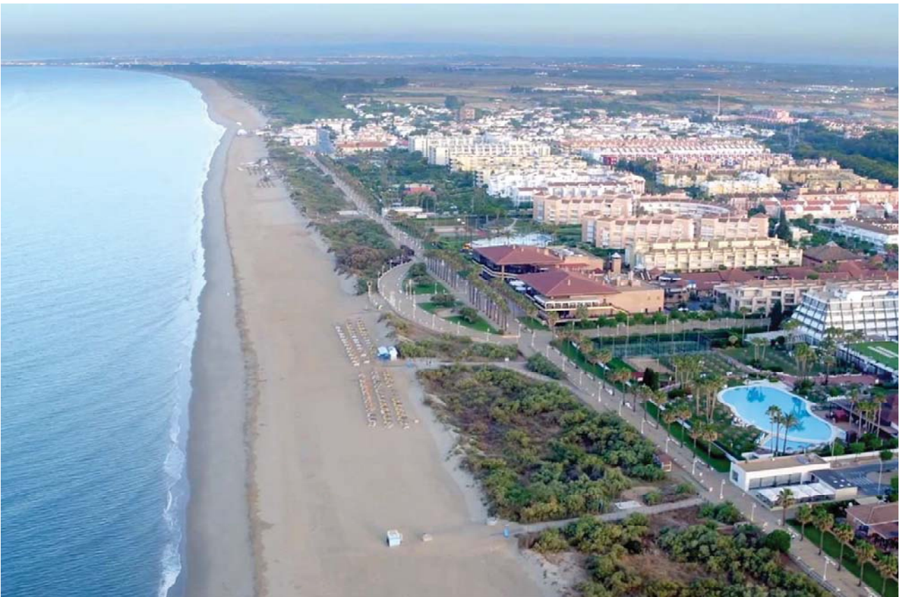
Vista aérea de la zona central de la playa de Islantilla