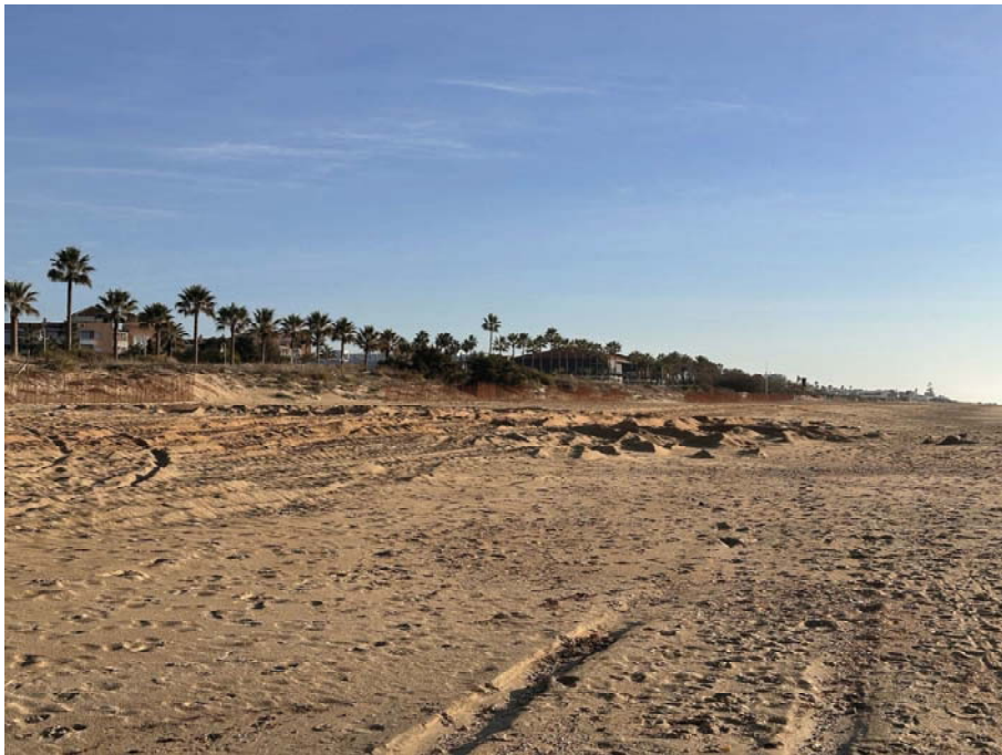
Imagen desde acceso de Paseo de Isla Cristina orientada hacia levante.