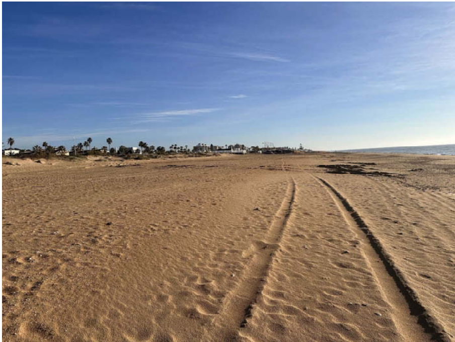
Imagen del extremo de levante de la playa.