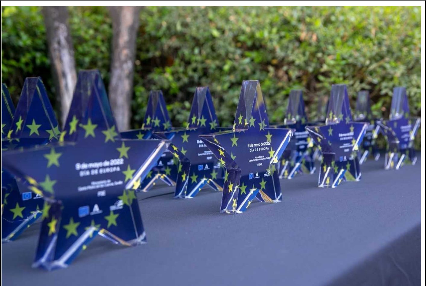
Imagen 3. Día de Europa 2022