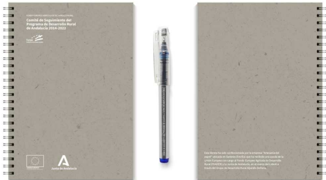
Imagen 4. Merchandising