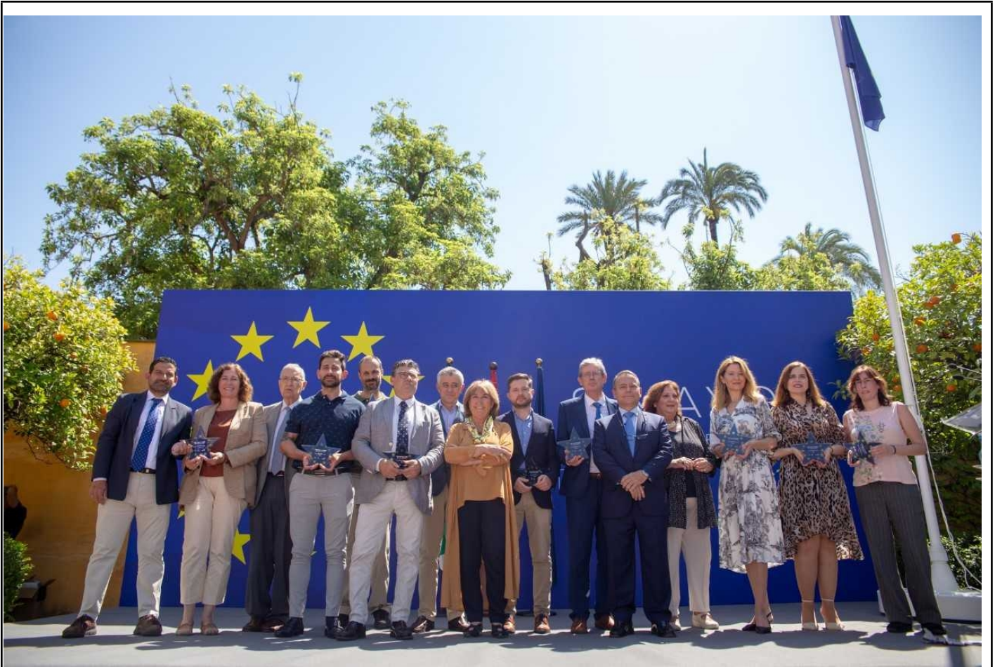
Imagen 2. Día de Europa 2022