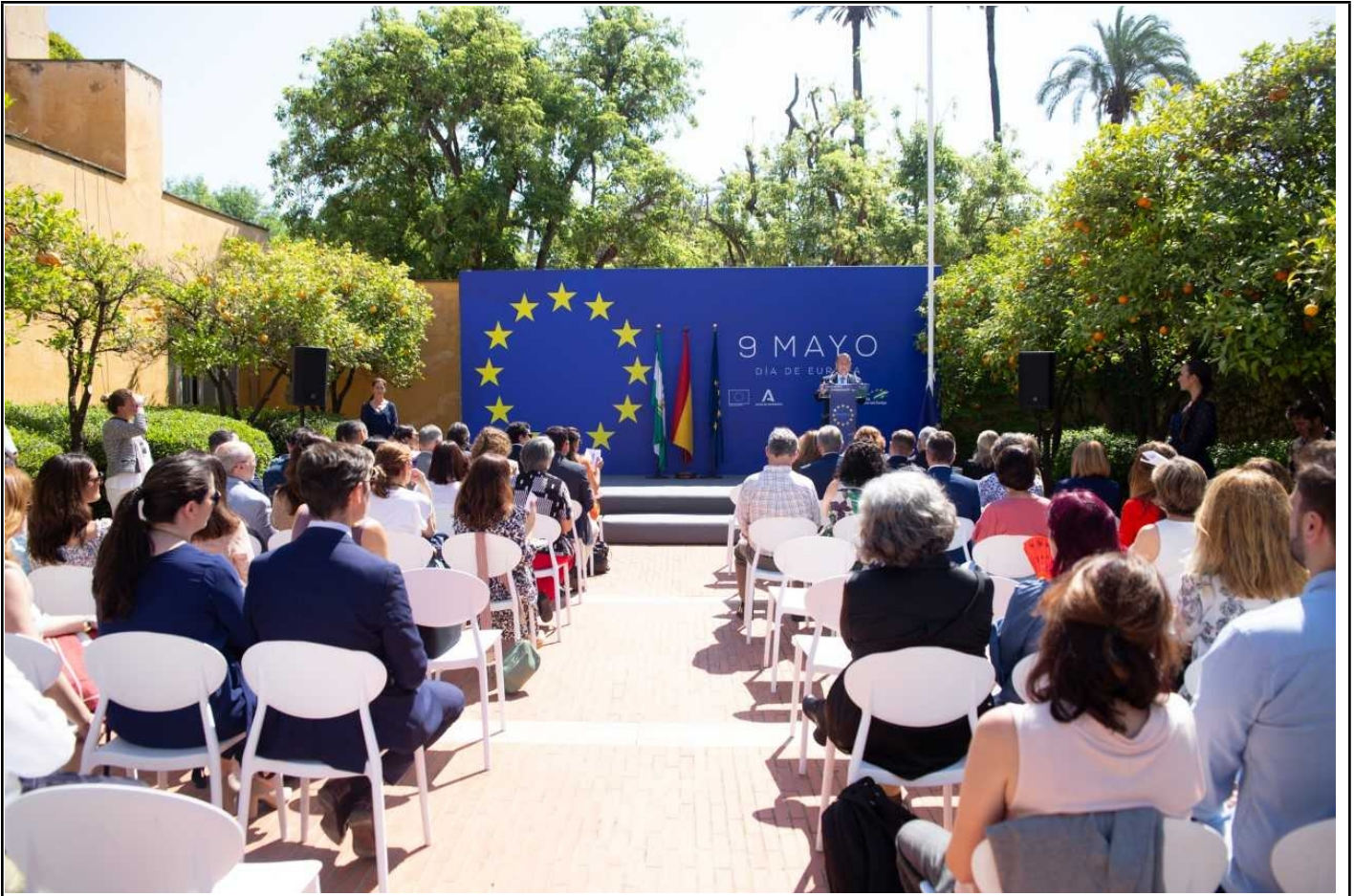
Imagen 1. Día de Europa 2022